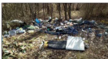
Skräpigt i Årsta. LÄSARBILD

Men det är för mycket och jag tycker det ska rensas bort. Jag hoppas verkligen att det inte finns kvar allt för länge. Jag tycker om