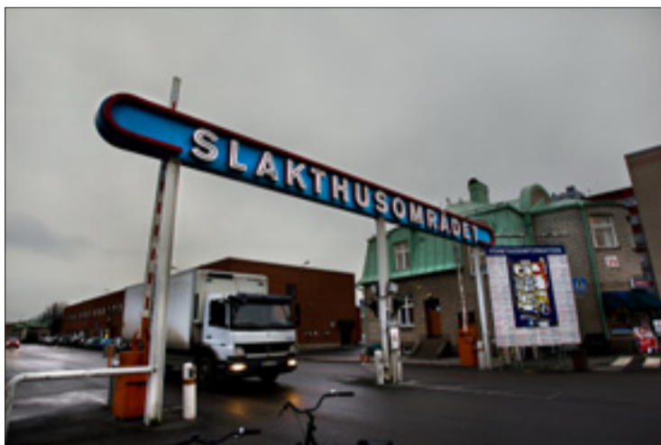
Ett Ikea-varuhus skulle ta död på all trivsel när Slakthusområdet ska nybyggas, anser insändarskribenten. ARKIVBILD

Haninge ville att man skulle bygga där i stället, men Ikea sa